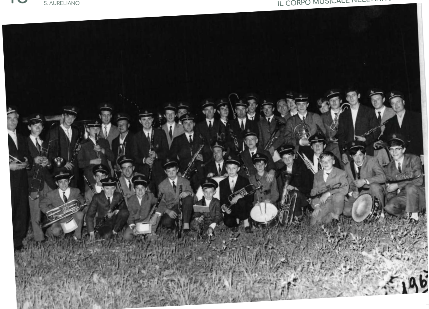
IL CORPO MUSICALE NELL'ANNO 1967