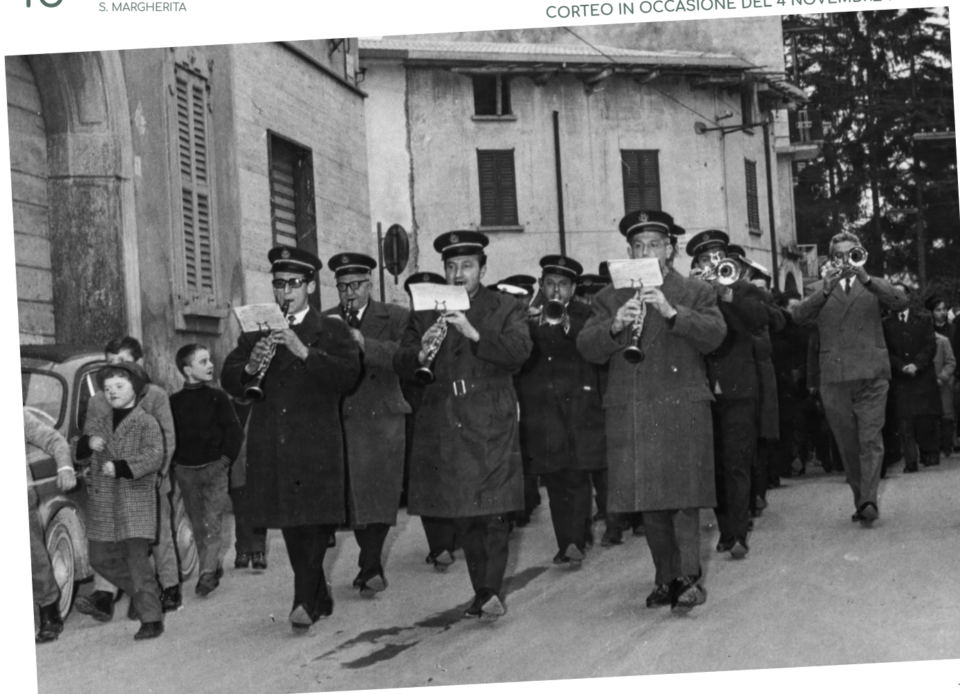
CORTEO IN OCCASIONE DEL 4 NOVEMBRE 1964