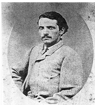
Giuseppe Cesare Abba